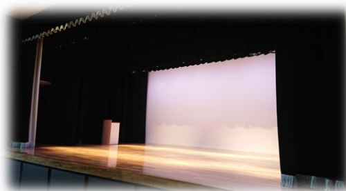
リニューアルした佐渡島開発総合センターホール

会場となる佐渡島開発総合センター3階ホールは、改修を終えたばかりでステージなどが、リニューアルされておりますので、この機会に併せてご覧ください。