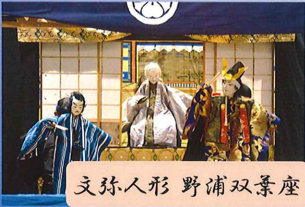
文弥人形 野浦双葉座