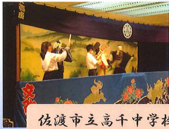
佐渡市立高千中学校