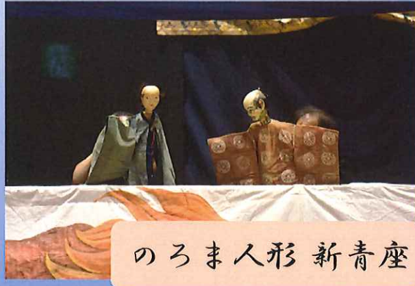
のろま人形 新青座