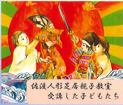
佐渡人形芝居親子教室 受講した子どもたち