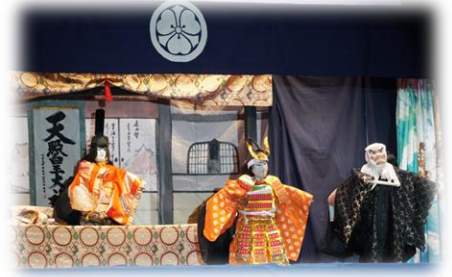
▲野浦双葉座、人形芝居