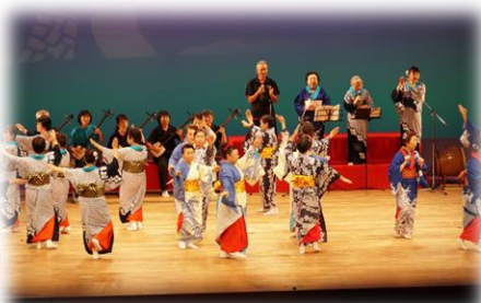
▲第5回佐渡民謡の祝祭