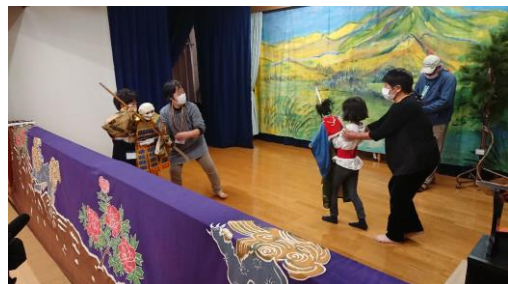
▼佐渡人形芝居保存会定期公演での発表