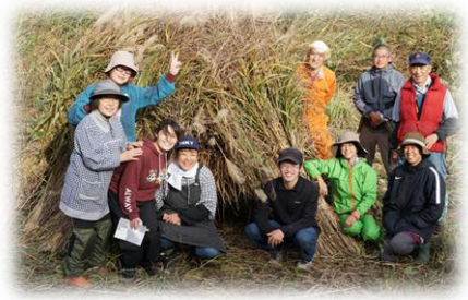
▲茅刈り講習ワークショップ