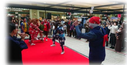
▲上野駅にて、岩首余興部の鬼太鼓