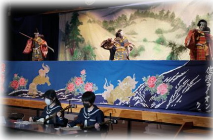
▲定期公演、高千中学校