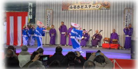
▲東京ドームにて、佐渡民謡披露