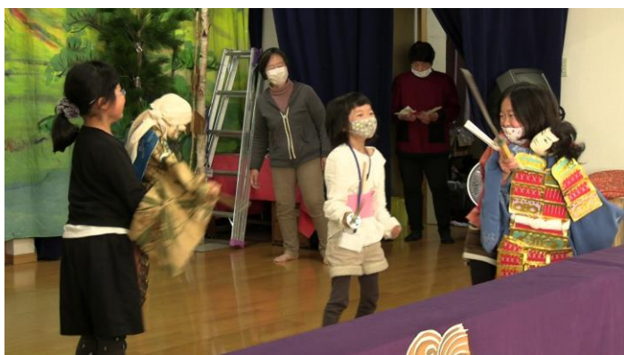
▲楽しく学ぶ、教室の様子