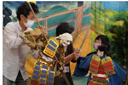
▲▼講師の指導を真剣に受ける親子

稽古の成果を披露する2回の発表会においては、堂々と演じて来場者から大きな拍手が贈られていました。