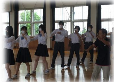
▲高校での民謡授業