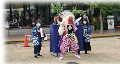
▲豊島区での文化交流事業