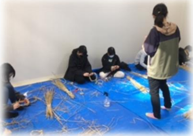
▲小学校でのわら細工体験

令和4年度は、「新潟県文化資源活用支援事業補助金」の採択事業として「佐渡産茅活用プロジェクト」の中で、関係者が一堂に会して意見交換を行ったワークショップや椿茅場で茅刈り講習を行いました。関係者が佐渡産の茅をどのようにしたら持続可能的に活用していけるのか考える貴重な機会となりました。